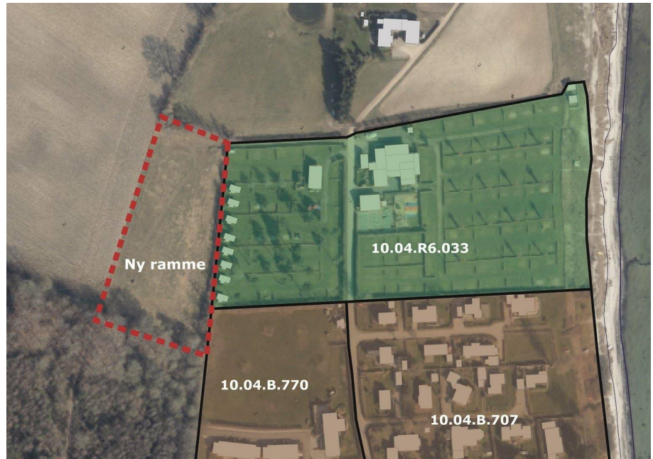
Luftfoto med eksisterende rammeområder samt forslag til nyt rammeområde